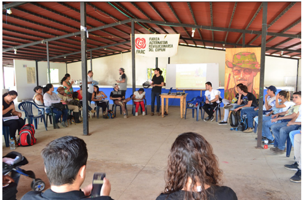
Inicio de los talleres de co-creación en el ETCR de Gaitania.

El proyecto comenzó a la par de la creación de la Mesa Técnica Cafetera de Gaitania, MTC, que representa a tres comunidades: líderes cafeteros, comunidad excombatiente del ETCR Marquetalia y comunidad indígena Nasa Wes'x. Inicialmente, se le solicitó a la Universidad de Ibagué que apoyara el proceso de creación de una marca colectiva de café que representara a las tres comunidades. Esta marca, según sus propias voces, debía representar el proceso de posconflicto que están viviendo y ser un símbolo de construcción colectiva de paz.